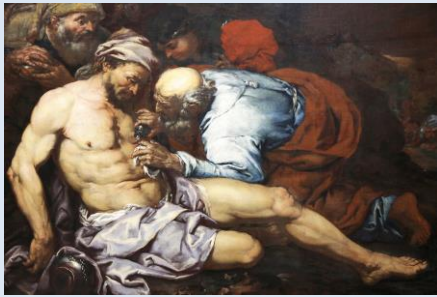
Giovanni Battista Langetti (vers 1660).

C'est un thème qui concerne tout le monde, croyants et non-croyants. En effet, la nature humaine, blessée par le péché, porte en elle la réalité des limites, de la fragilité et de la mort. Ce thème répond d'ailleurs à une préoccupation qui me tient particulièrement à cœur, à savoir que la maladie et la finitude sont souvent perçues dans la pensée moderne comme une perte, une non-valeur, une nuisance qu'il faut minimiser, contrer et annuler à tout prix. On ne veut pas se poser la question de leur signification, peut-être parce qu'on craint leurs implications morales et existentielles. Pourtant, personne ne peut se soustraire à la recherche de ce « pourquoi » (cf. JEAN-PAUL II, Lettre apostolique Salvifici doloris , 9). Même le croyant peut parfois vaciller face à l'expérience de la douleur. C'est une réalité effrayante qui, lorsqu'elle perce et assaille, peut laisser la personne désespérée, au point de briser sa foi. La personne se trouve alors à la croisée des chemins : soit elle laisse la souffrance la conduire à se replier sur elle-même, jusqu'au désespoir et à la révolte ; soit elle l'accueille comme une occasion de croissance et de discernement de ce qui compte vraiment dans la vie, jusqu'à la rencontre avec Dieu. [...] La Bible n'offre donc pas une réponse banale et utopique à la question de la maladie et de la mort, ni une réponse fataliste, qui justifierait tout en l'attribuant à une justice divine