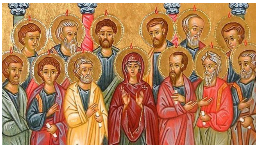
Dimanche 28 mai : Pentecôte